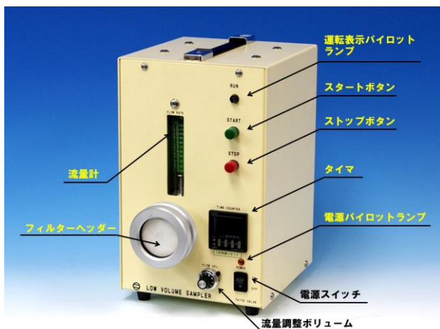
可変流量型ダストサンプラ 各機器名