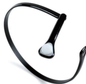
眼の水晶体用線量計 DOSIRIS

弊社では、眼の近傍を測定する測定器も ございます。ご使用されている防護眼鏡の 効果確認に、ぜひご活用ください。