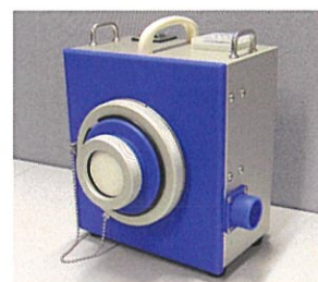
CHC用アダプタ取付(参考)