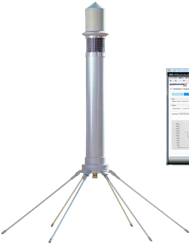
設置イメージ (ソーラパネル内蔵型)