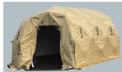
●DRASH テント(住民検査・受付用テント)