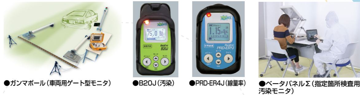
●ガンマボール(車両用ゲート型モニタ) ●B20J(汚染) ●PRD-ER4J(線量率) ●ベータパネルΣ(指定箇所検査用汚染モニタ)