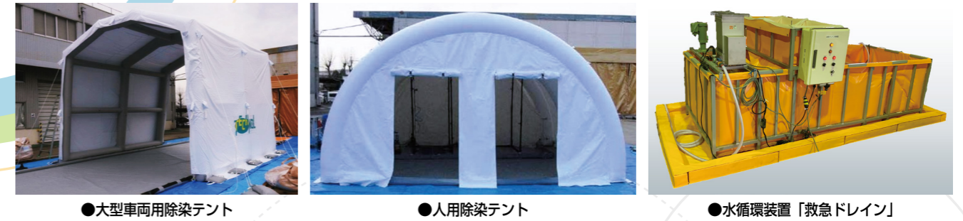
●大型車両用除染テント ●人用除染テント ●水循環装置「救急ドレイン」