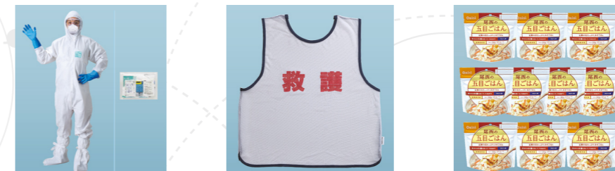
●防護服セット ●ビブス ●保存食