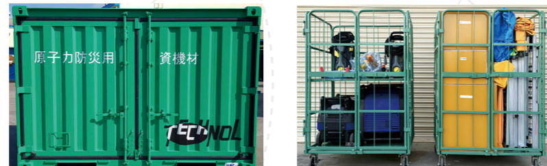
●10ft コンテナ(運搬用保管容器) ●観音開きカゴ台車