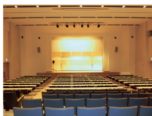
コンベンションセンター(Hosoda Hall)