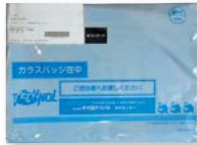
フィルム袋 (ピロー包装)