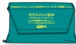
GB キャリー (小)