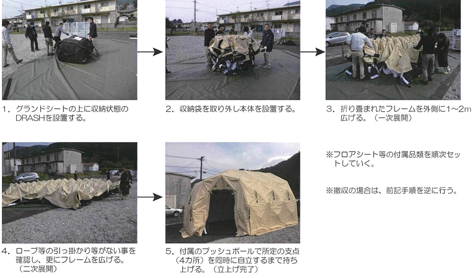
※展張の流れ：3XB-CHの場合